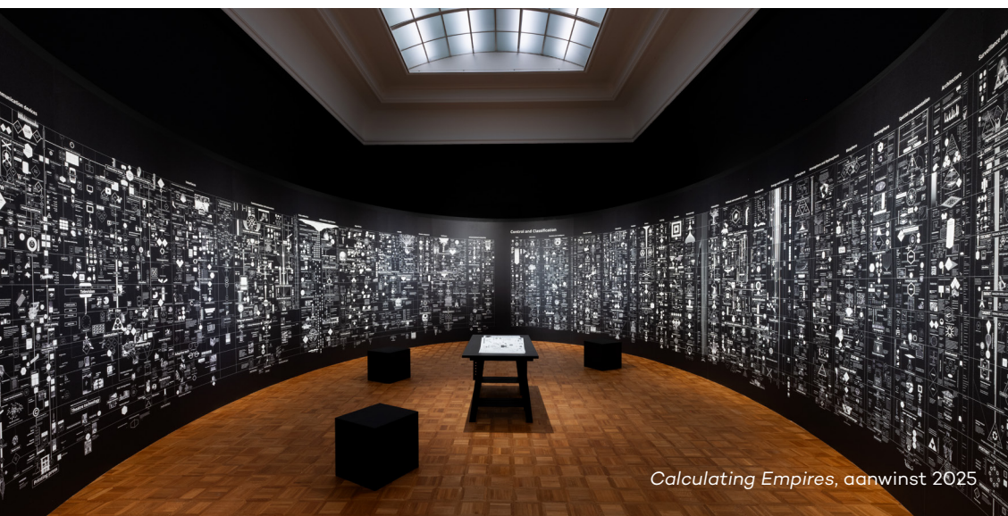
Calculating Empires, aanwinst 2025