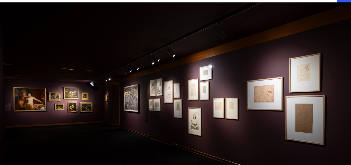
Links 'Untitled' van Femmy Otten in de zaal 'Door de ogen van de ander' in de collectie-presentatie 'Ik, de ander en de aarde'.