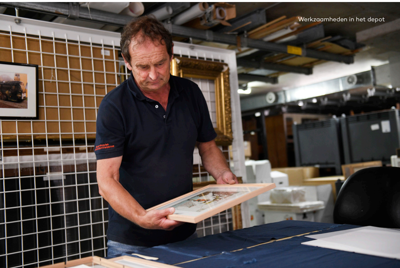
Werkzaamheden in het depot

In totaal zijn 54 werken uit de collectie aan een conditiecontrole onderworpen, gefotografeerd en gedocumenteerd. Bij acht werken vond uitgebreider onderzoek of een uitgebreidere behandeling plaats. Dit betrof in sommige gevallen kleine restauraties of conserverende handelingen, en in andere gevallen verdiepend onderzoek, zoals microscopisch onderzoek om de conditionele toestand van een mogelijke nieuwe aanwinst te beoordelen.